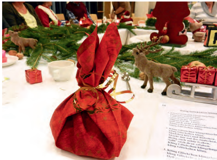
Nikolaussäckchen bei der Adventsfeier in der Betreuungsgruppe Kaltental

In der Begleitung wird es darum gehen – ausgehend von Geschichten über den heiligen Nikolaus – zu überlegen, was alles in ein Nikolaussäckchen gepackt werden könnte und wem die Gäste gerne ein solches schenken möchten. Danach schauen sich die demenzkranken Menschen und